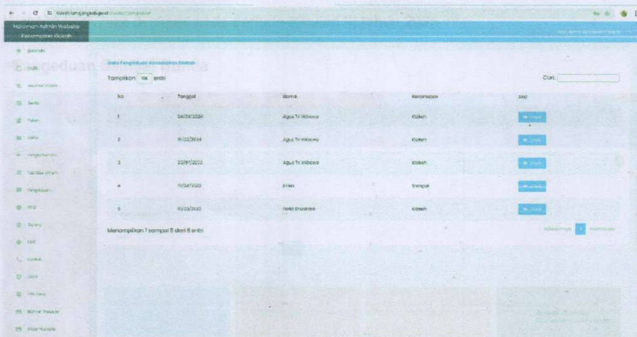
Foto Pengaduan di Web Kecamatan

Tidak ada pengaduan pada periode tribulan III tahun 2025.