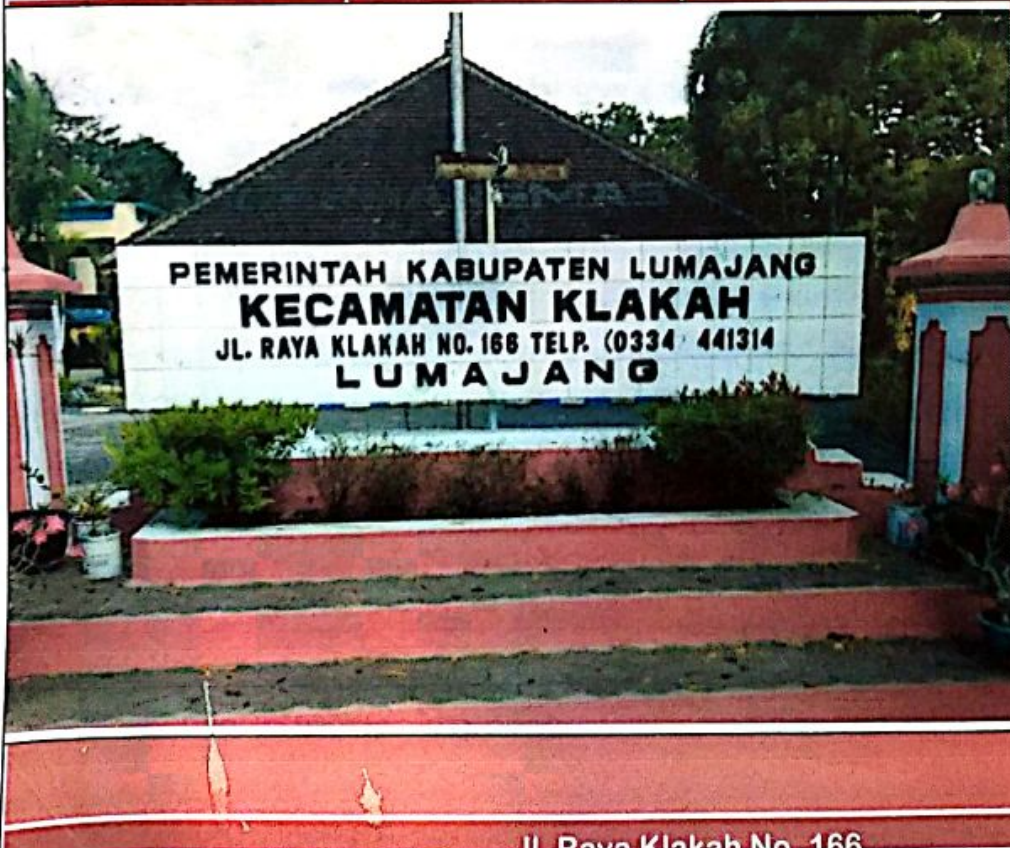
Jl. Raya Klakah No. 166